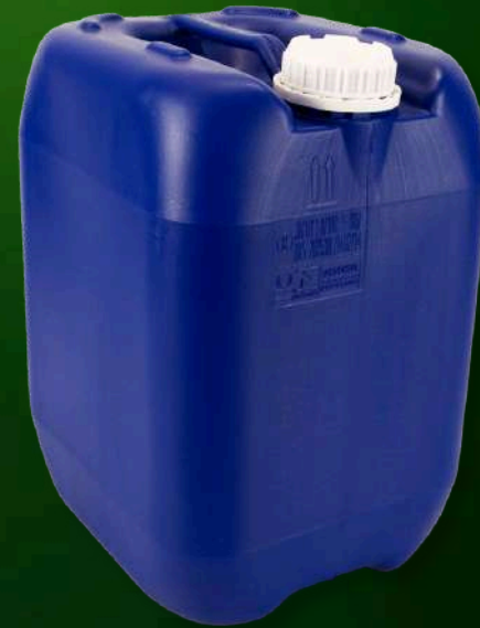
Bombona de polipropileno - 30 ou 60kg