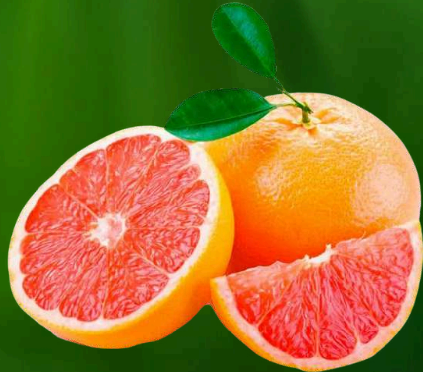
POMELO Pulpa concentrada: Aseptico.