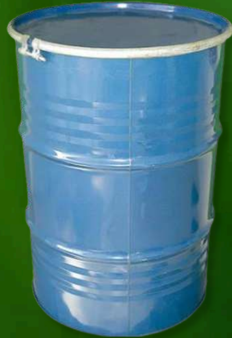
Tambor de metal - 180kg