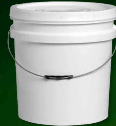
Cubo de polipropileno - 18kg