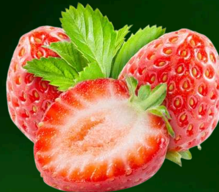
FRESA Pulpa integral y concentrada: Aseptico.