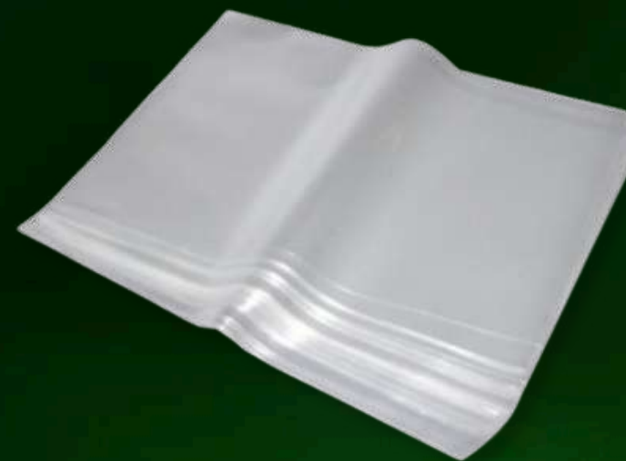
Bolsas de polipropileno - 100g a 25kg