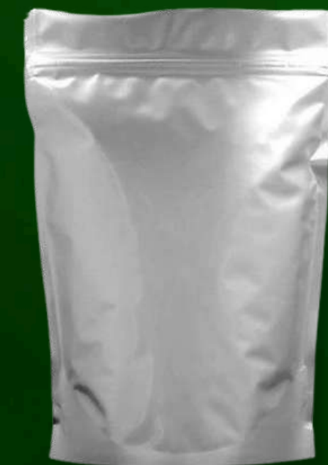
Sacos de alumínio - 100g a 25kg