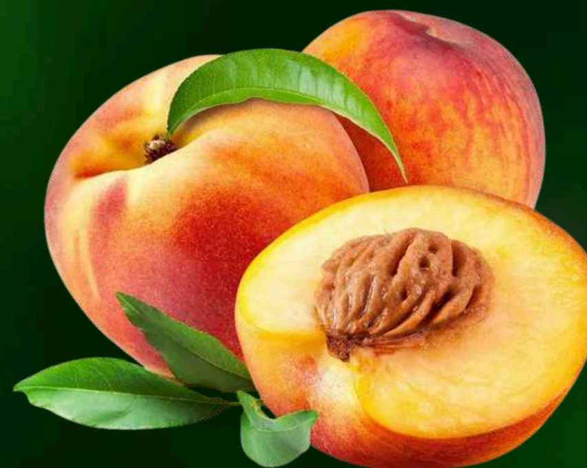
PESSÊGO Polpa integral concentrada: Asséptico