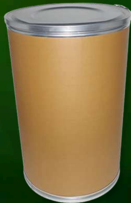
Tambor de papelão - 30kg