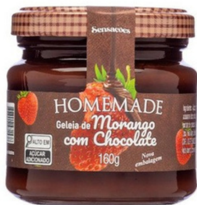
Frutilla con Chocolate

Nuestros sabores: Frutilla con Chocolate, Apple Pie y Red Velvet.