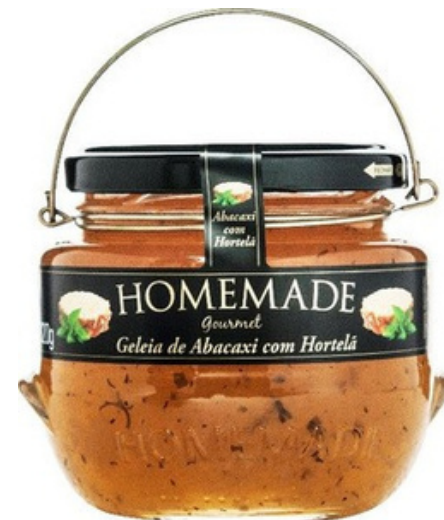
Piña con Menta