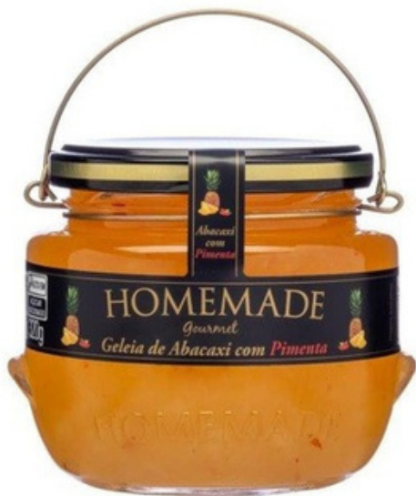
Piña con Pimienta

Mermelada gourmet de Piña con Pimienta. Mermelada estilo gourmet, con un sabor dulce a piña tropical seguido de ese toque especial de pimienta "Dedo de Moça", creando una deliciosa combinación para acompañar y añadir más sabor a tus platos de carne, cerdo y aves nobles.