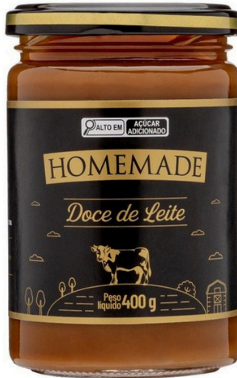
Dulce de Leche

Dulce de Leche producido cuidadosamente de forma artesanal, rescatando una receta argentina. Dulce de Leche Premium Homemade, una experiencia única!