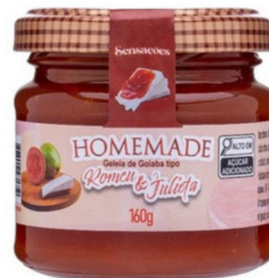
Romeo & Julieta