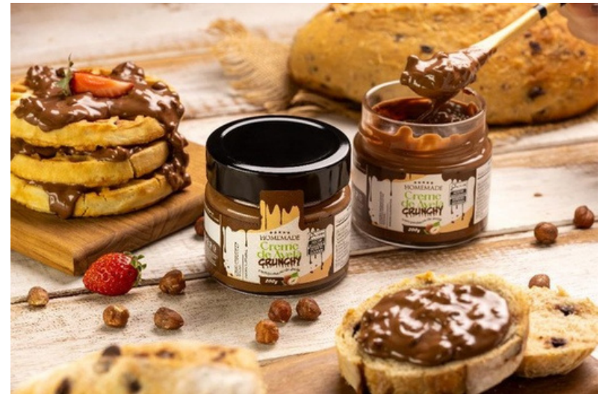
Crema de Avellanas