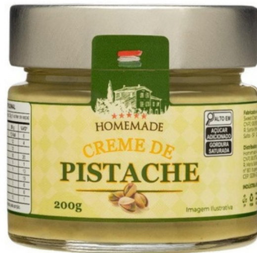
Crema de Pistacho

Productonoble , con un sabor único y almendrado, elaborado con pistachos importados de Italia, un fruto que ha conquistado a todos. Su consistencia cremosa y aterciopelada da alas a la imaginación para recetas o para consumir a cucharadas en casa.