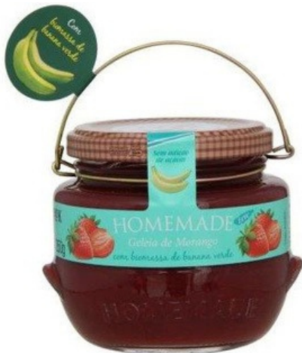
Frutilla Cero con Biomasa

Mermelada de Frutilla con biomasa verde. Hecha en nuestra casa, especialmente para usted!