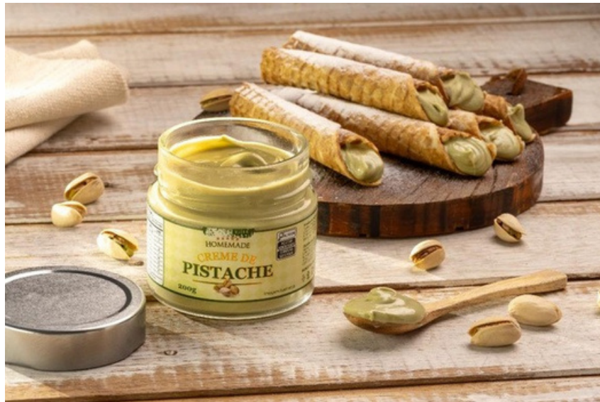
Crema de Pistacho

La Crema de Pistacho destaca por su sabor auténtico y equilibrado, con pistachos frescos y un toque de dulzura natural. Ideal para agregar un toque sofisticado a postres o platos especiales. ¡Pruebe nuestros nuevos lanzamientos y descubra el verdadero sabor gourmet!