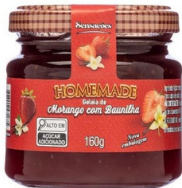
Frutilla con Vainilla

Nuestros sabores: Frutilla con Vainilla, Banoffee y Romeo & Julieta.