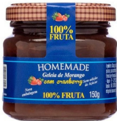
Frutilla con arándano

Entressabores: FrutosRojos, Frutillacon Arandanosy Damasco.