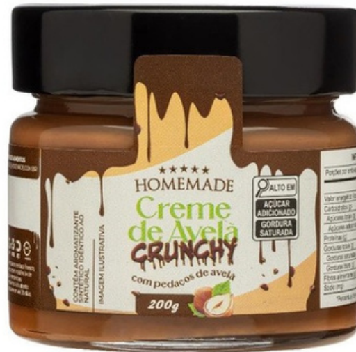
Crema de Avellanas

Crema de Avellanas , Este producto ya está bien posicionado entre los consumidores. Sin embargo, en Homemade buscamos algo diferente y lúdico para mejorar su sabor. Añadimos trozos de avellana, también importados de Italia, para aportar una textura crujiente a la crema, ofreciendo una nueva experiencia, con un “crunchy taste” característico.