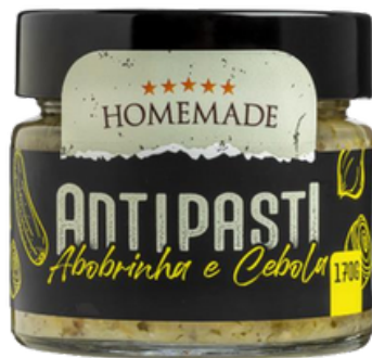
Zucchini y Cebolla