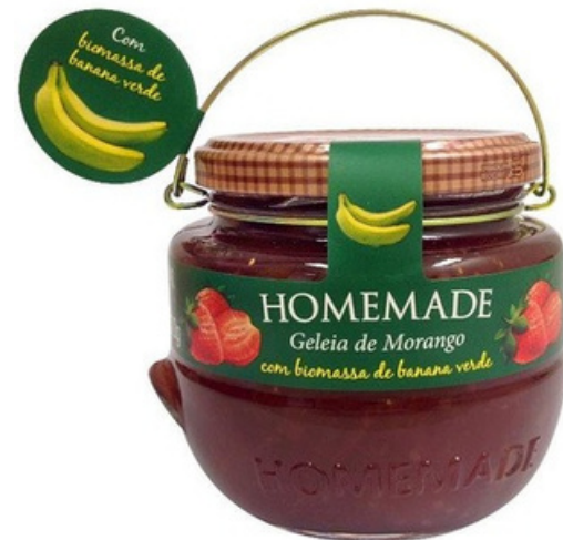
Frutilla con Biomasa