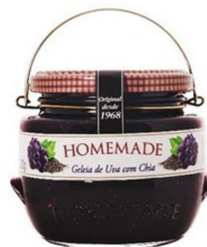
Uva con Chia